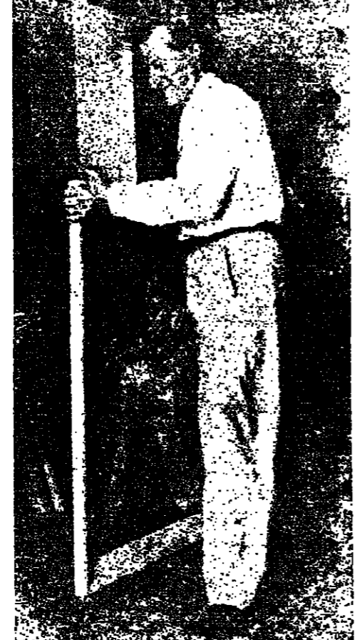
في مرمره عام ١٩٥٧

الواجب الفنية التي كانت شابة حين كان يؤسس اكااديمية الفنون التي خرجت اول ما خرجت جيل الفنانين الذين صنعوا هذا القرن الذهبي ، ابتداء من شقيق بيرو وسعيد ، عقل وذهن الخال ، الى امين الباشا وطيم جردان ، وعارف الرئيس ، فان من الواجب ان تكون اعمال تيمر الجليل في متناول الجميع يشاهدنا الجميع ونشاهدنا كل العيون اللبنانية . لقد كان من الضروري ان نتمثل لهذا الفنان القليل القليل ما فعله لنا .